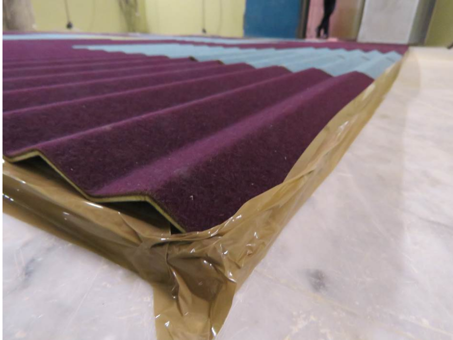
Dettaglio / Detail