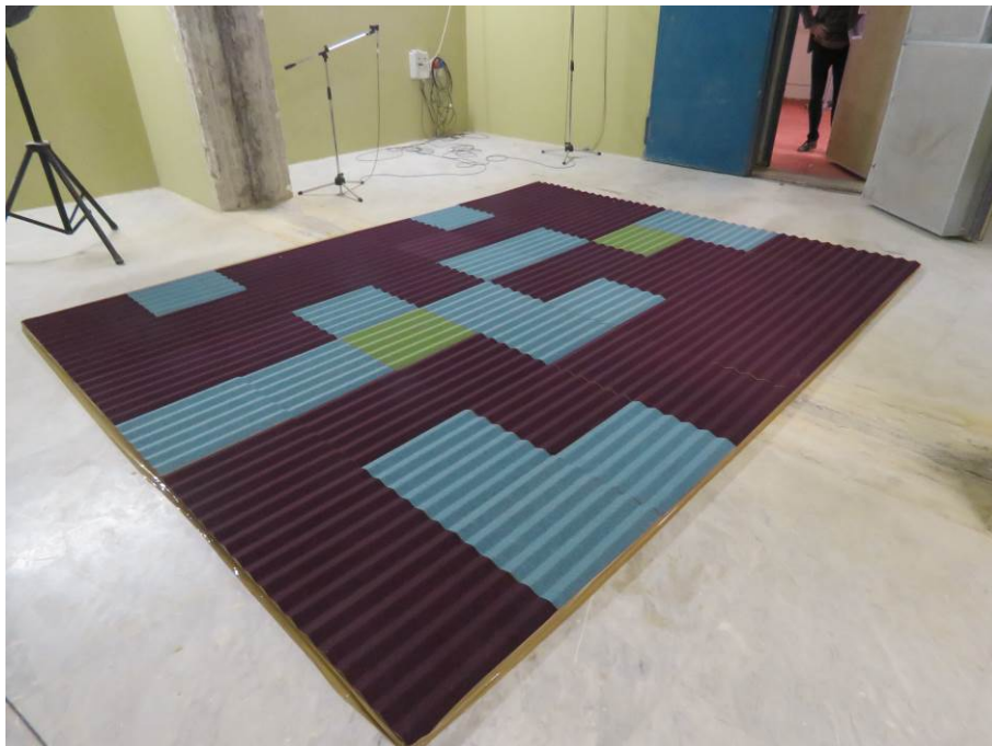
Foto durante il test / Photo during the test