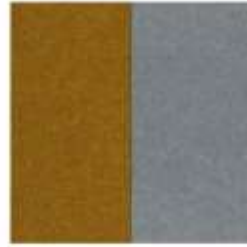
ECOfelt Mustard 54 PETfet Grey 4