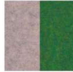
ECOfelt Quartz rose 940 PETfet Jugle green 31