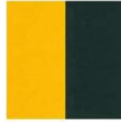
PETfelt Yellow 3 PETfet Grey green 22

Piccole impurità o macchie di colore sono da attribuire al processo di produzione e unicità del prodotto. Small impurities or color spots belong to production and product uniqueness.