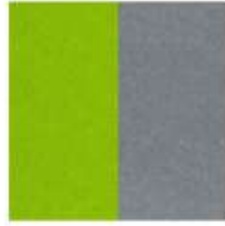
ECOfelt Acid green 611E PETfet Grey 4