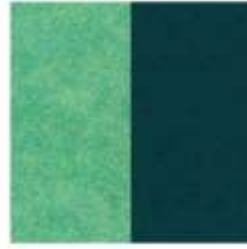
PETfelt Celadon 39 ECOfet Lagoon 608