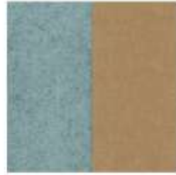
ECOfelt Fresh air 976 PETfet Beige 16

Peso | weight: Spessore | thickness: 420 gr/mtl 1,5 mm 820 gr/mtl 3 mm 1200 gr/mtl 4,5 mm 1630 gr/mtl 6 mm 2000 gr/mtl 8 mm