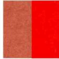
ECOfelt Salmon 317 PETfet Dark Orange 14