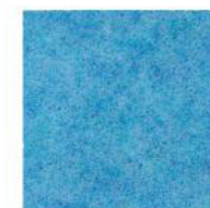
Egg blue 38