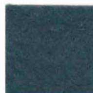
Grey green 22