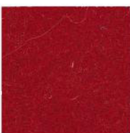
Ruby red 27