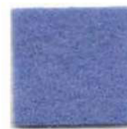
Light blue 914