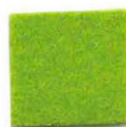
Acid green 611E