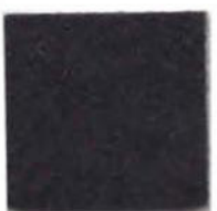
Rich black 18