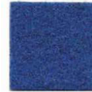
Honolulu blue 607