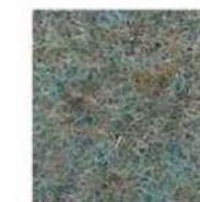
Mineral blue 311