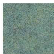
Salvia green 334E