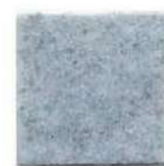
Fresh air 976