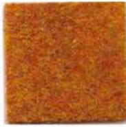
Cob orange 997