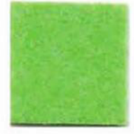
Acid green 7