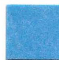
Light blue 8