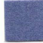
Blue yonder 200