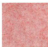
Pastel pink 37