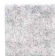
Ghost white 955