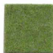
Cashmere green 89