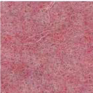
Blossom pink 335