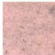
Quartz rose 940