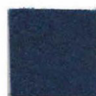
Dark blue 5