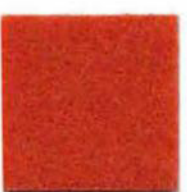
Dark Orange 14