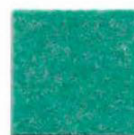
Water green 2