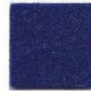
Deep sea blue 963