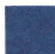
Summer night 21