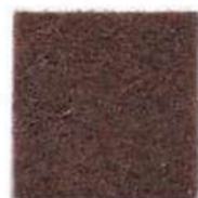
Dark musk 22