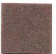
Tuscan brown 20