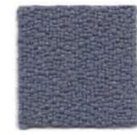
Quartz grey 636