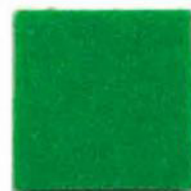
La salle green 12