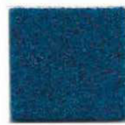
Peacock blue 962