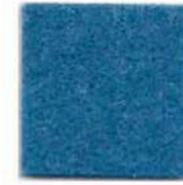
Sky blue 942