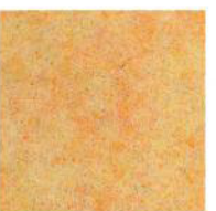
Pale yellow 41