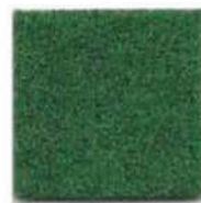
Leaf green 910