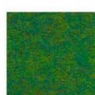
Jungle green 31