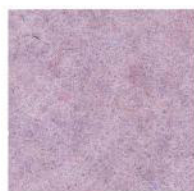
Wisteria pink 36