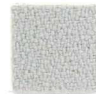
Pearl grey 643