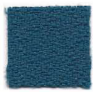
Peacock blue 411