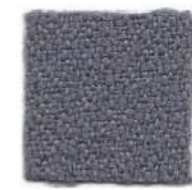
Old silver 625