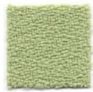
Green tea 425