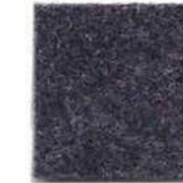
Dark grey 923