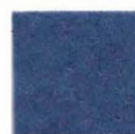
Summer night 21