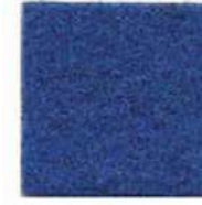
Honolulu blue 607