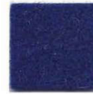
Deep sea blue 963