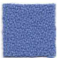
Pastel blue 380