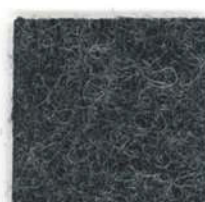
Dark grey 603