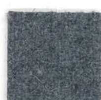
Rock grey 602