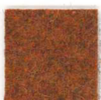
Terra di Siena 103