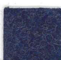
Night blue 302