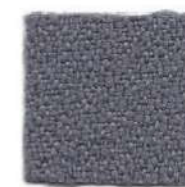
Old silver 625