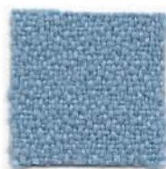
Light blue 386