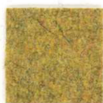
Dark gold 52