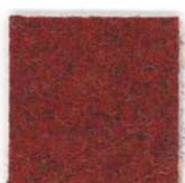
Antique ruby 201