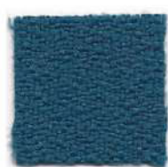
Peacock blue 411