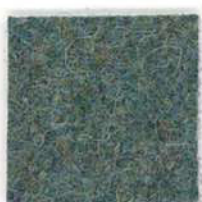
Racing green 453