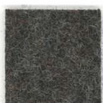
Old brown 553