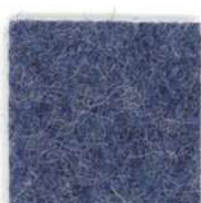
Grey blue 301