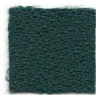
Forest green 496