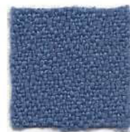
Queen blue 378