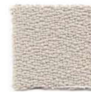
Light grey 611T