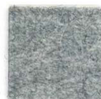
Ash grey 601