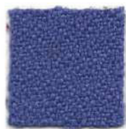
Steel blue 263