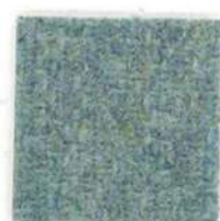
Aqua green 455