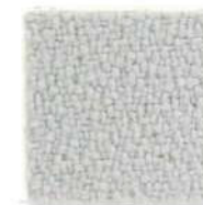
Pearl grey 643