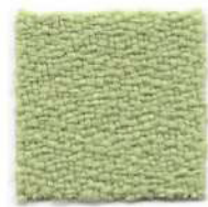
Green tea 425