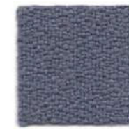
Quartz grey 636