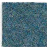
Teal blue 454