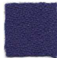
Dark blue 334T