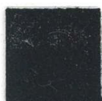
Full black 651