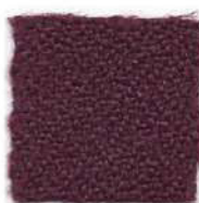
Red wine 234