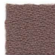
Tuscan brown 534