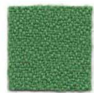
Office green 443