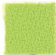
Apple green 463