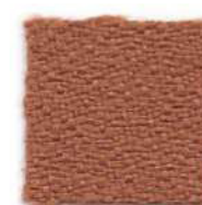
Tiger eye 119