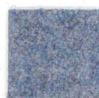
Air blue 351