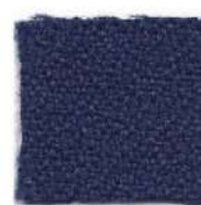
Midnight blue 333T