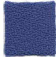
Office blue 332T