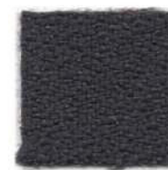
Dark mud 571