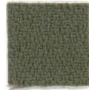
Brown sugar 569