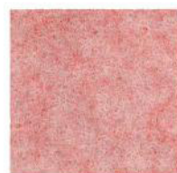
Pastel pink 37