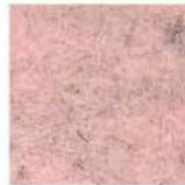
Quartz rose 940