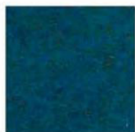
Pacific blue 29