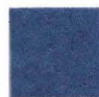
Summer night 21