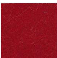
Ruby red 27