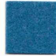
Sky blue 942