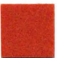
Dark Orange 14