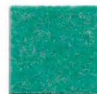
Water green 2