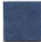
Summer night 21