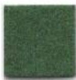
Leaf green 910