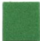
La salle green 12