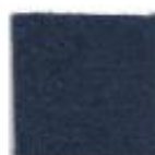
Dark blue 5