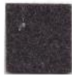
Dark brown 552