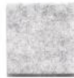
Ghost white 955