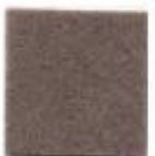
Tuscan brown 20