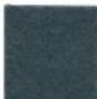
Grey green 22