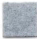
Fresh air 976