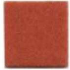
Dark orange 14