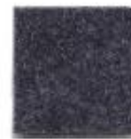
Dark grey 923