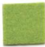
Acid green 61IE