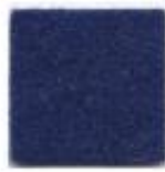
Deep sea blue 963