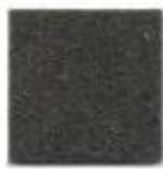
Dark musk 22