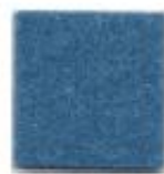
Sky blue 942