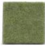
Cashmere green 89