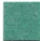
Water green 2