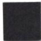
Rich black 18