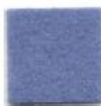
Light blue 914