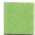
Acid green 7