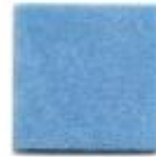
Light blue 8