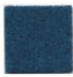
Peacock blue 962