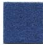
Honolulu blue 607