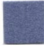
Blue yonder 200