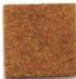
Cob orange 997