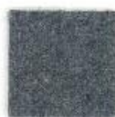
Rock weed 602