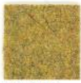
Dark gold 52