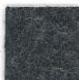
Dark grey 603