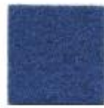
Honolulu blue 607