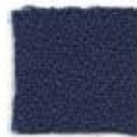
Midnight blue 333