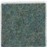
Racing green 453