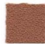
Tiger eye 119