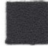
Dark mud 571