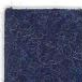
Night blue 302