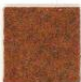
Terra di Siena 103