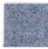
Air blue 351