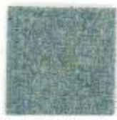
Aqua green 455