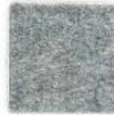
Ash grey 601