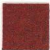
Antique ruby 201