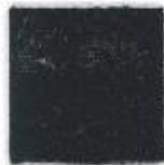
Full black 651