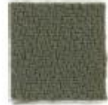
Brown sugar 569