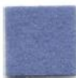
Light blue 914