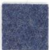
Grey blue 301