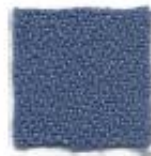
Queen blue 378