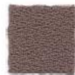
Tuscan brown 534