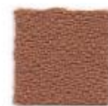
Tiger eye 119