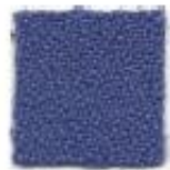
Steel blue 263