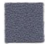
Quartz grey 636