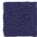
Dark blue 334