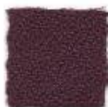
Red wine 234