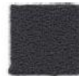
Dark mud 571