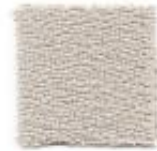
Light grey 611T