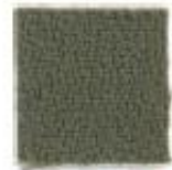
Brown sugar 569