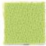
Apple green 463