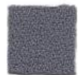
Old silver 625