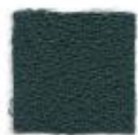
Forest green 496