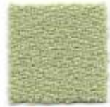
Green tea 425