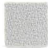
Pearl grey 643