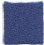
Office blue 332