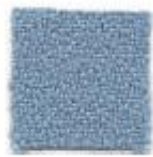
Light blue 386