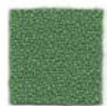
Office green 443