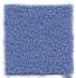
Pastel blue 380