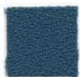
Peacock blue 411