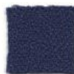
Midnight blue 333